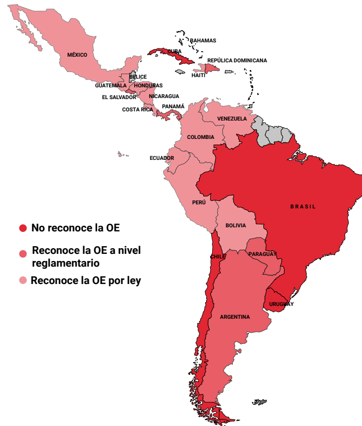
Figura 2. Regulación de la observación electoral (OE) en América Latina