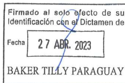
Rocío Benítez de Descalzo Contadora

A handwritten signature in black ink, appearing to read 'Rocío Benítez de Descalzo', written over a horizontal line.